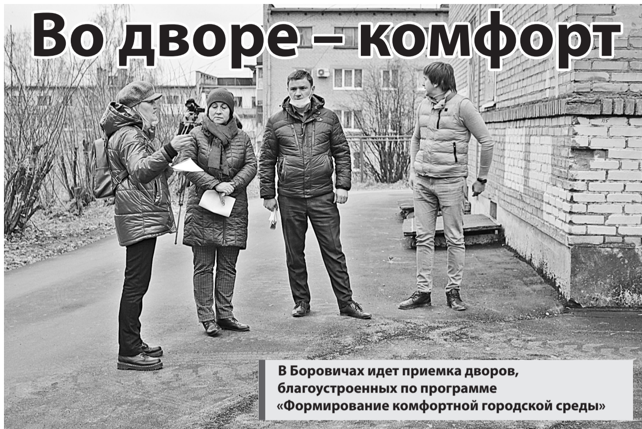
В Боровичах идет приемка дворов, благоустроенных по программе «Формирование комфортной городской среды»